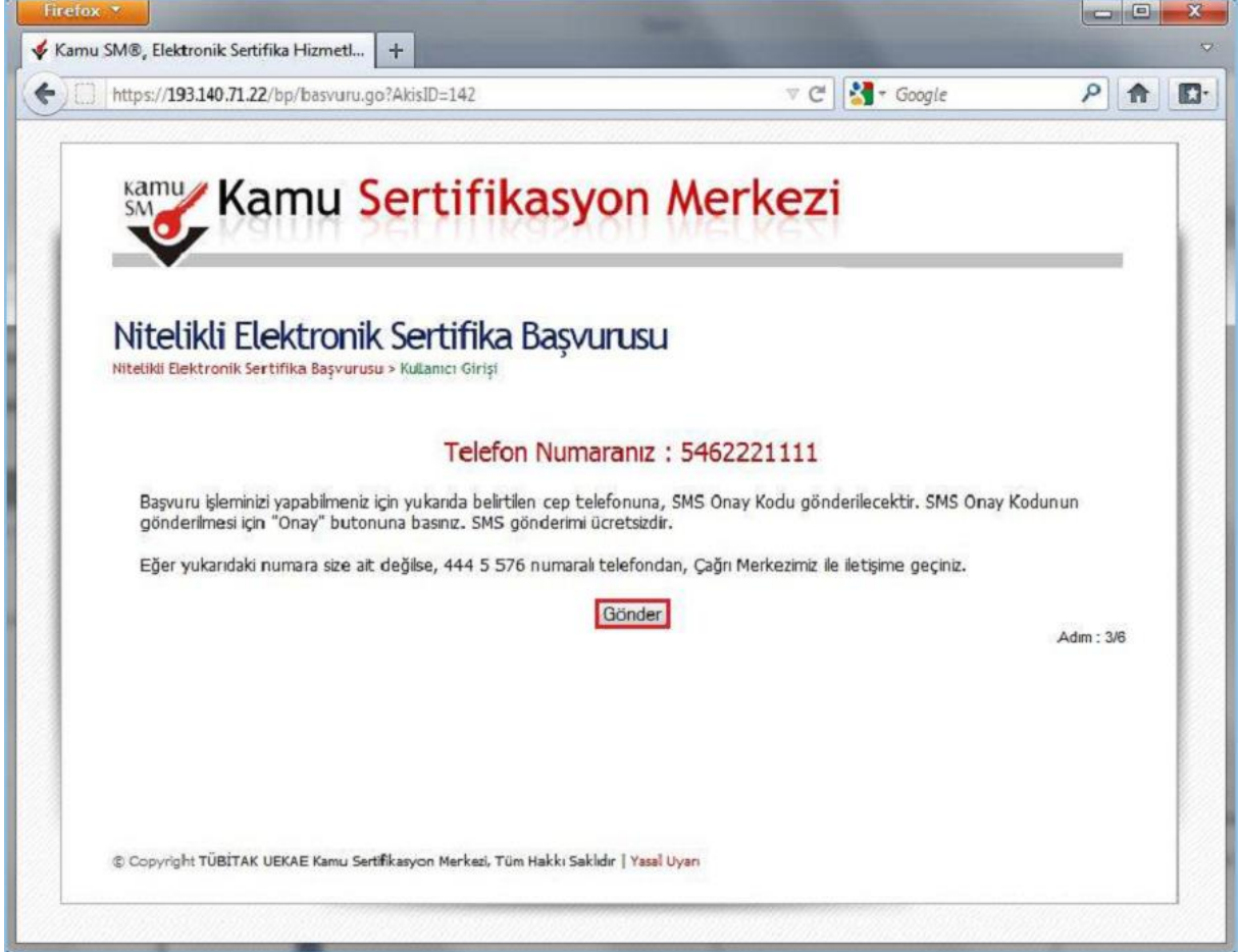
Şekil 3 - SMS Onay Kodu Gönderim Ekranı

Form onaylandıktan sonra SMS Onay Kodu gönderim ekranı (Şekil 3) görüntülenecektir. Başvuru formunu doldururken Cep Telefonu alanına girdiğimiz Cep Telefonu numarası görüntülenir. Gönder butonuna basıldığında ekranda görüntülenen cep telefonu numarasına SMS Onay Kodu gider.