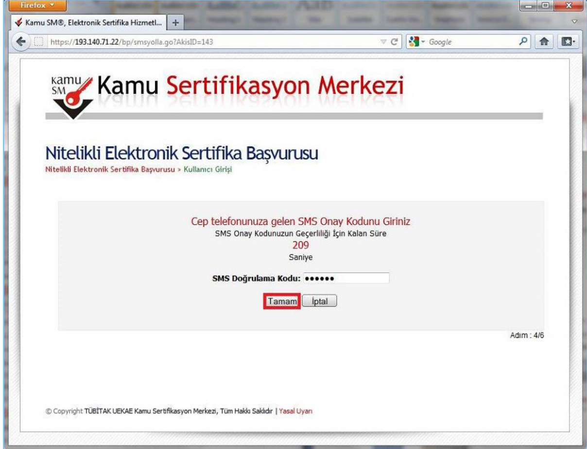
Şekil 4 - SMS Doğrulama Kodu

SMS Onay Kodu giriş ekranındaki SMS Doğrulama Kodu alanına cep telefonuna gelen SMS Onay Kodu girilir ve Tamam butonuna basılır. ( Şekil 4 )